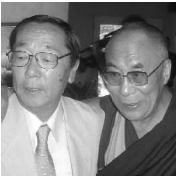
Emoto mit dem Dalai Lama

Dass alle Materie in Wirklichkeit nichts Anderes als Schwingung ist, bestätigt auch die moderne Quantenmechanik. Wenn wir Dinge in immer kleinere Einheiten aufspalten, kommen wir in eine unerklärliche Welt aus Teilchen und Wellen... aus Elektronen, die sich wellenartig um einen Atomkern herum bewegen. Alles vibriert und schwingt unaufhörlich in extrem hoher Geschwindigkeit. Nicht nur Menschen und Objekte, auch die verschiedensten immateriellen Phänomene dieser Welt besitzen eine ihnen eigene Wellenlänge - Orte und Plätze, das Wetter, die Erdatmosphäre... einfach alles, was uns umgibt, vibriert. Somit hat auch alles eine ureigene Frequenz, die man auf